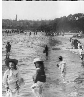
am Köhlbrand um 1910